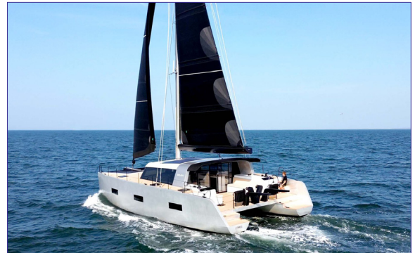
Vaan R5 - VAAN YACHTS