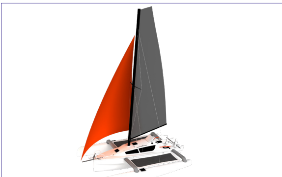
TRICAT 8.50 - TRICAT