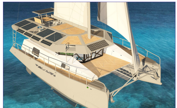
Tortue 147 - CATARUGA