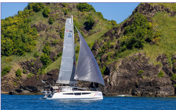
C CAT 38 STD - COMAR YACHTS