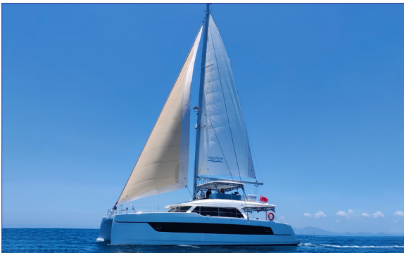
Seaview 59 - HEYSEA YACHTS