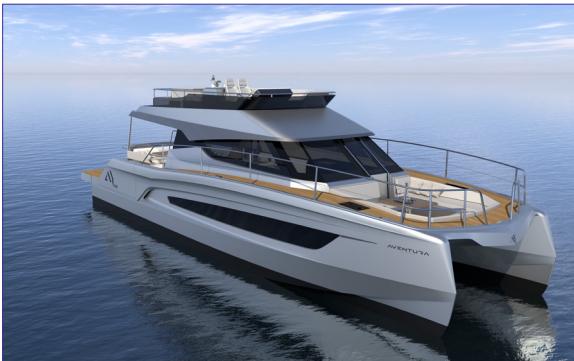
A38MY - AVENTURA YACHTS