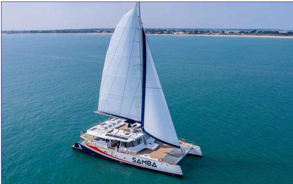
DAY 1 80.09 SAMBA - DAY ONE