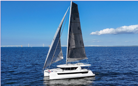
Leopard 46 PC - LEOPARD CATAMARANS