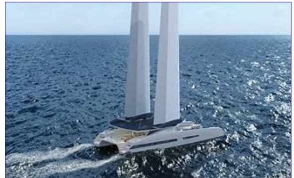
MODX 70 - MODX CATAMARANS