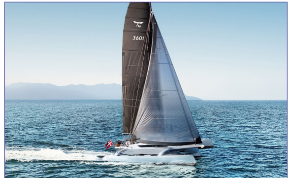
Dragonfly 36 - HELLOMULTI