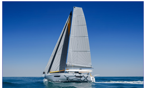
Excess 13 - EXCESS CATAMARANS