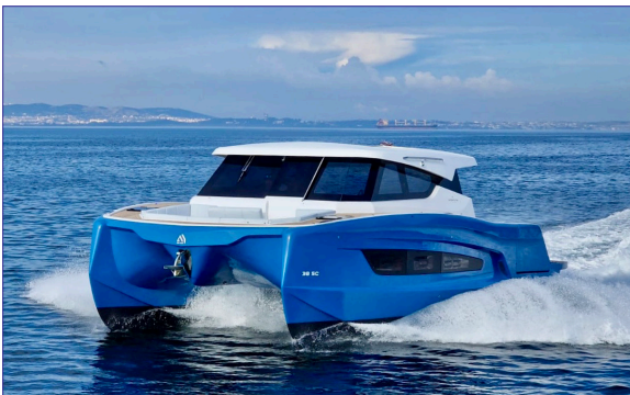
A38SC - AVENTURA YACHTS