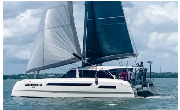
MC 44 SC - MAX CRUISE MARINE