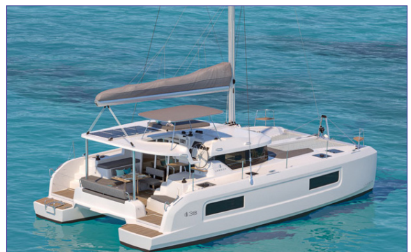
Lagoon 38 - LAGOON CATAMARANS